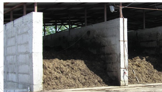
Фаза I. Ферментация компоста в открытом бункере