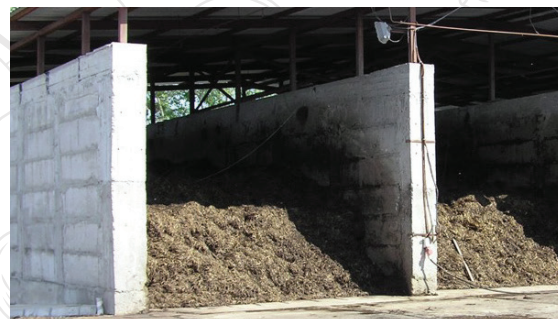
Фаза I. Ферментація компосту у відкритому бункері